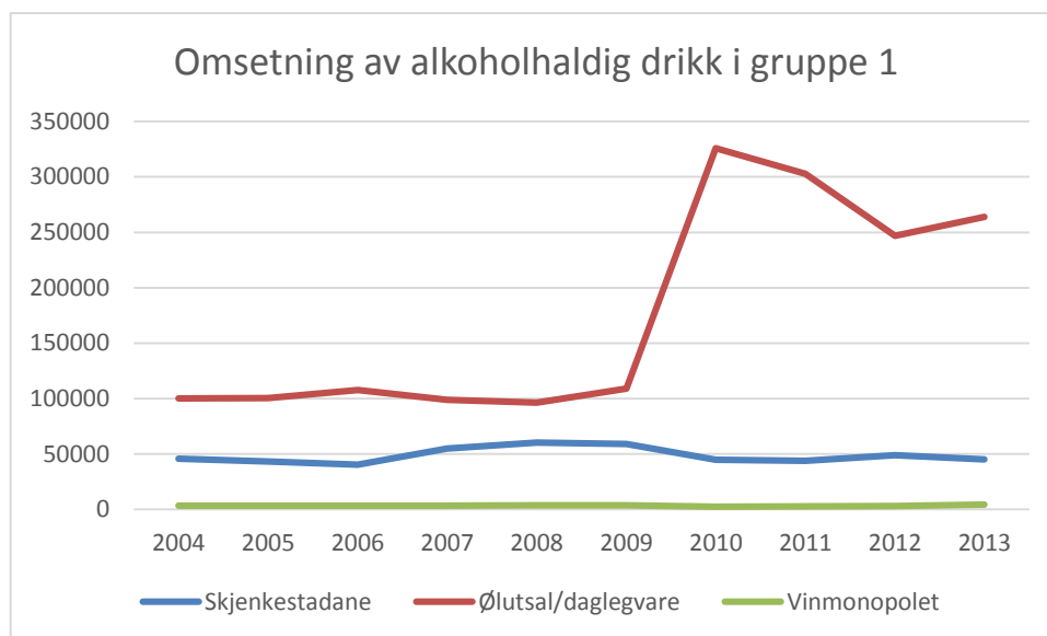
Figur 2: Omsetning av alkoholhaldig drikk i gruppe 1 i Ulstein kommune i perioden 2004-2013, målt i liter, fordelt etter salsarena 1